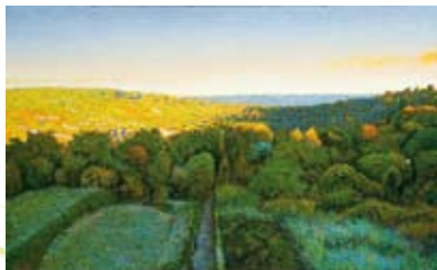
La vallée de l'Eure - 97x162 - 2007